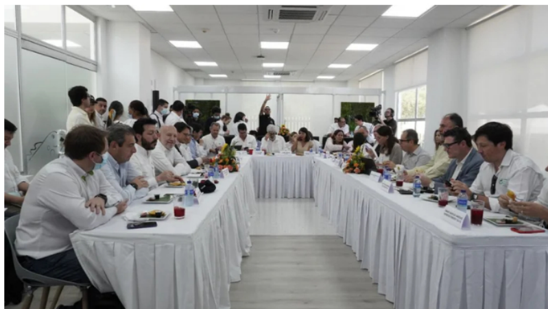
Diálogo binacional sobre la política de reindustrialización basada en las energías renovables y el desarrollo del sector del hidrógeno verde.

“En nuestro objetivo de ser un actor clave en la transición energética de la región, Ecopetrol tiene gran interés en tener acceso temprano al desarrollo de nuevas tecnologías en Alemania y generar transferencia de conocimiento para su escalamiento en Colombia”, agregó Bayón.