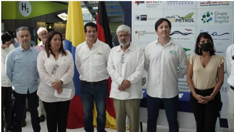
Diálogo binacional sobre la política de reindustrialización entre Colombia y Alemania.

Representantes de sectores públicos y privados de Colombia y Alemania adelantaron el primer diálogo binacional sobre la política de reindustrialización basada en las energías renovables y el desarrollo del sector del hidrógeno verde .