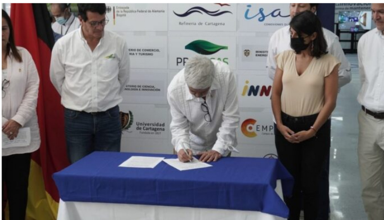
Alemania y Colombia adelantaron el primer Diálogo Binacional sobre la política de reindustrialización basada en las energías renovables y el desarrollo del sector del hidrógeno verde.

Representantes de sectores públicos y privados de Alemania y Colombia adelantaron el primer Diálogo Binacional sobre la política de reindustrialización basada en las energías renovables y el desarrollo del sector del hidrógeno verde.