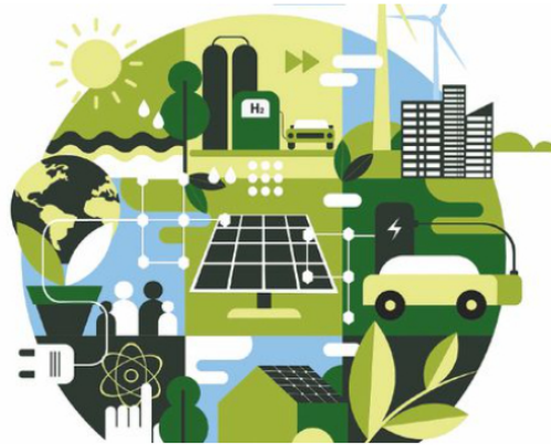
El hidrógeno verde es el más limpio, pues se obtiene a partir del agua.