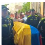
Lea También: Con honores despidieron en Cúcuta a subintendente asesinado en Bogotá

En el segmento de exploración y producción la inversiones esperan alcanzar una producción orgánica en 2023 entre 720.000 y 725.000 barriles de petróleo equivalentes por día, el 76% para petróleo y 24% para gas y productos blancos.