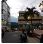
Lea También: En Ocaña: alcalde y gobernador lanzaron el 'Plan Navidad'

Para la seguridad energética, sostenibilidad financiera y favorecer la balanza comercial del país los recursos estarán entre $15.8% a $18.9.