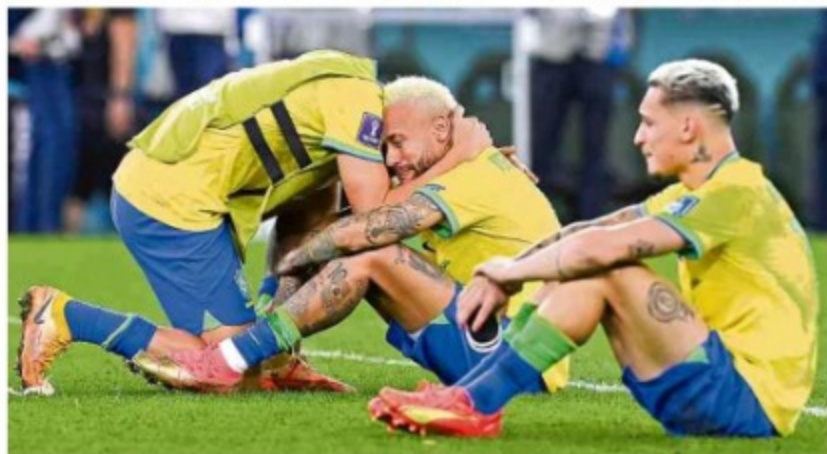
La definición desde los 12 pasos le trajo ayer a Suramérica alegría y tristeza por igual. Neymar y el resto de la constelación de Brasil no pudo anotarle a Croacia, subcampeona del mundo, y se despidió de Catar tras desperdiciar dos penaltis. Después, Messi y compañía empataron 2-2 con el equipo de Países Bajos, al que finalmente vencieron 4-3 en los cobros de desempate. Argentina y Croacia son los primeros semifinalistas. Vivamos el Mundial / 2.1