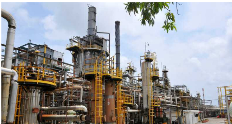
Refinería de Barrancabermeja.

¿Recuerdan que en 2021 hubo una polémica contra Ecopetrol porque habría una posible escasez de velas por falta de parafina? En noviembre del año pasado se conoció que el Día de las velitas estaba en posible riesgo, pues no había la suficiente parafina en el mercado para la producción de velas.