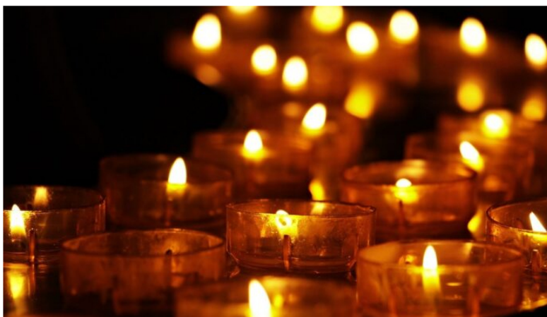
Día de las Velitas en Colombia.

Por Yennyfer Sandoval - Periodista Minería y Energía - 2022-12-07