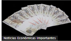
Noticias Económicas Importantes

Banco Central de Brasil mantuvo tasa de interés en 13,75 %