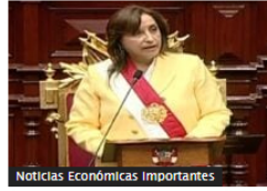
Noticias Económicas Importantes

Banco Central de Brasil mantuvo tasa de interés en 13,75 %