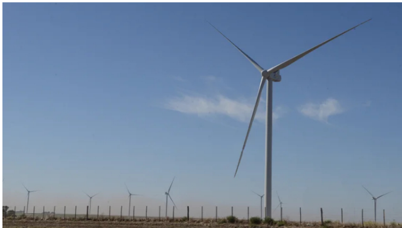
En Argentina, existen grandes extensiones con viento, radiación solar, aguas abundantes y una matriz energética capaz de avanzar en la transición hacia las energías renovables (Fernando Calzada)

Colombia debe desarrollar una estrategia enfocada en la adaptación al cambio climático para mejorar su infraestructura y otras condiciones que lo hacen más vulnerable a la variabilidad climática ante la transición energética que propone el Gobierno de Gustavo Petro , la cual debe desarrollarse de manera justa, sostenible, con la protección de la soberanía energética y sin frenar el crecimiento económico del país.