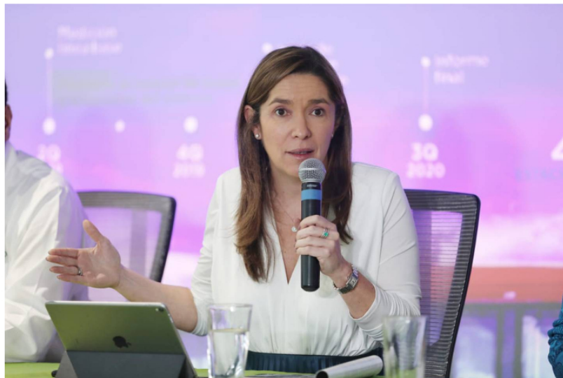
María Fernanda Suárez

Germán Arce Zapata, actual presidente de la Asociación de Fiduciarias de Colombia (Asofiduciarias). Ha sido director de Crédito Público, viceministro de Hacienda y ministro de Minas y Energía. Es economista de la Universidad del Valle y tiene una maestría de la Universidad de Reading en Inglaterra; además cuenta con experiencia en los bancos HSBC y ABN Amro.