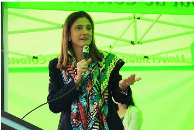
Ángela María Orozco, exministra de Transporte

En la lista también hay una candidata que, según conoció Bloomberg Línea, fue impulsada directamente por el expresidente Iván Duque: Ángela María Orozco, quien fue su ministra de Transporte. También ha sido ministra de Comercio, presidenta de Proexport (ahora ProColombia) y socia fundadora de Research and Opportunities. Graduada en derecho y ciencias económicas de la Universidad Javeriana, con maestría en Jurisprudencia Comparada de la Universidad de Texas (Estados Unidos) y especialización en derecho económico de la Universidad Externado.