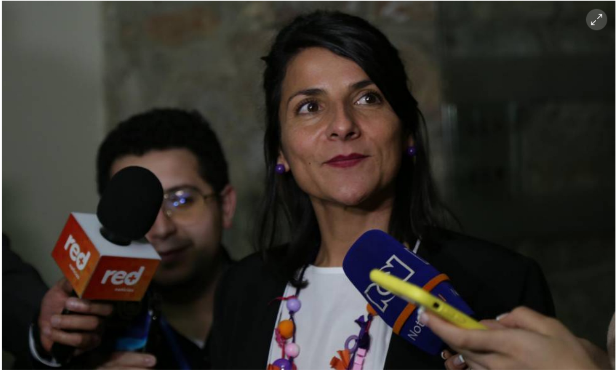
Irene Vélez, ministra de Minas y Energía.