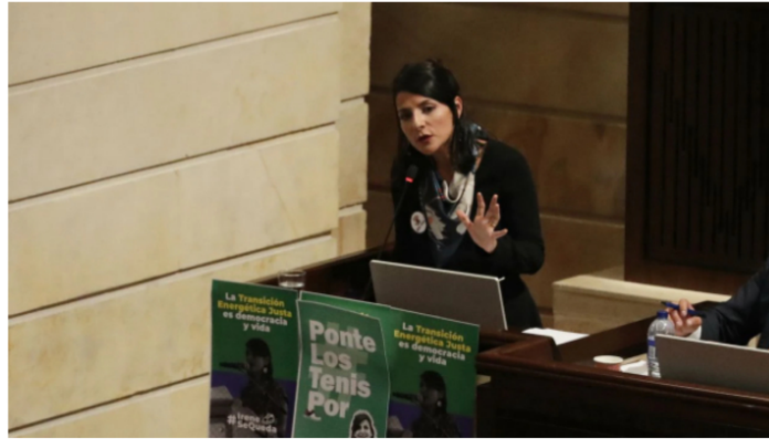
Moción de censura Ministra de Minas y Energía Irene Vélez

La ministra de Minas y Energía, Irene Vélez, podrá volver a acomodarse al cuadro con su foto que tiene colgado en la oficina, pues según todas las cuentas que se hacen en el Congreso, el próximo martes, cuando se votará la moción de censura en su contra, saldrá victoriosa y arropada por una coalición de Gobierno que se ha mostrado inquebrantable.