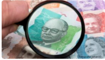
Estas son las marcas más valiosas de Colombia