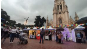
Emprendedores bogotanos se le adelantaron a la Navidad