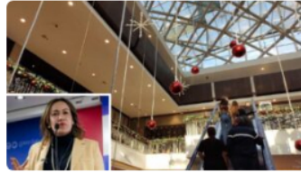
En alerta el comercio: regresará el tapabocas obligatorio