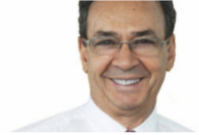
El sector petrolero y el cambio climático