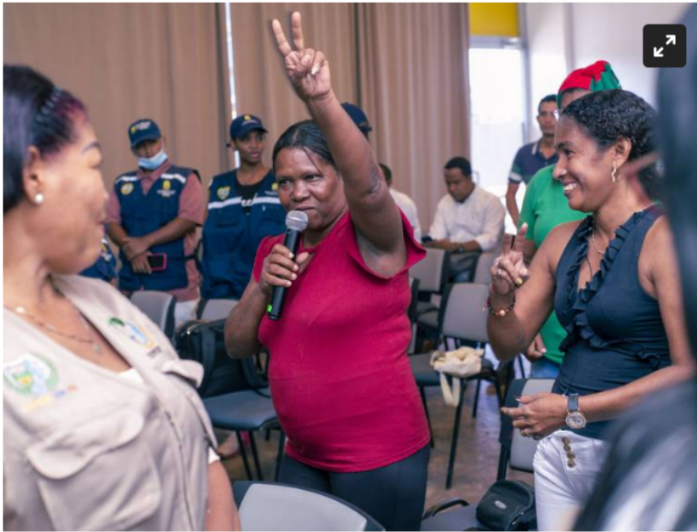
Alcaldía de Cartagena

La Secretaría de Participación y Ecopetrol fortalecieron alianza en pro de las comunidades de la ciudad