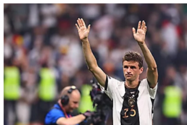
La Polémica Mundial: ¿Qué pasa con Alemania?