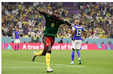
Aboubakar anotó el gol de la victoria de Camerún ante Brasil y salió expulsado