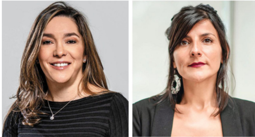
La exministra Minas María Fernanda Suárez se refirió al debate que hay sobre la gestión de la ministra Irene Vélez.

La exministra de Minas y Energía María Fernanda Suárez, que formó parte del gobierno del expresidente Iván Duque, entró en la polémica que se ha generado en torno a la ministra de Minas y Energía, Irene Vélez, quien adelantó un debate de moción de censura en el Congreso.