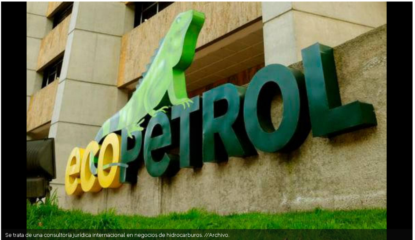
Se trata de una consultoría jurídica internacional en negocios de hidrocarburos.

Con la polémica encendida, el Ministerio de Minas y Energía reconoció que el contrato sí existe. Estos son los detalles.