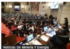
Noticias De Minería Y Energía

MinMinas Irene Vélez: Colombia tendría reservas de gas natural hasta 2042