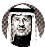
Abdulaziz bin Salman Ministro saudita de Energía

“El actual recorte continúa hasta finales de 2023 y, si es necesario tomar más medidas reduciendo la producción para equilibrar la oferta y la demanda, siempre estamos dispuestos a intervenir”, dijo el 21 de noviembre el ministro saudita de Energía, el príncipe Abdulaziz