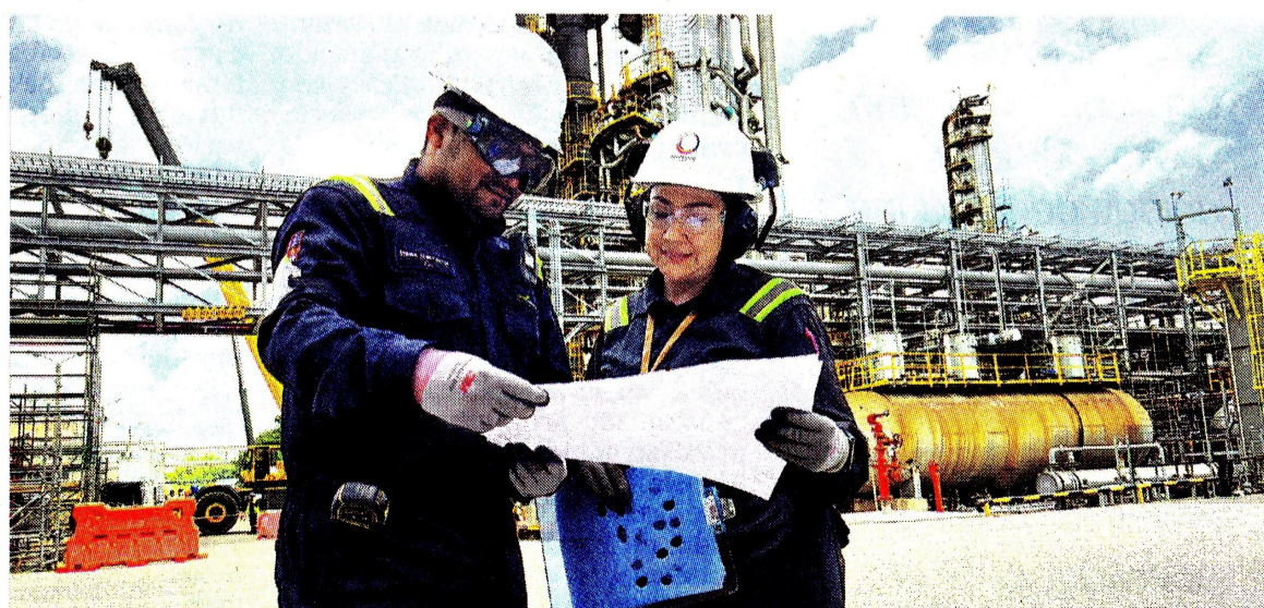
Desde el Caribe colombiano, la refinería de Cartagena es uno de los engranajes del aparato económico colombiano.