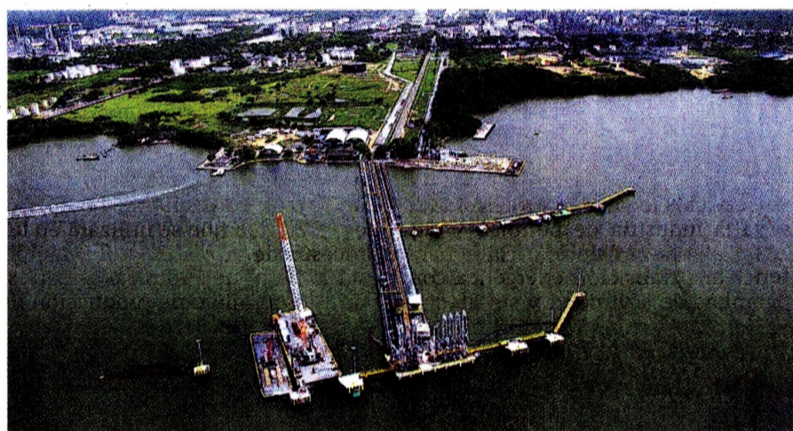
En el 2021 la refinería pagó impuestos a la Nación y a Cartagena por cerca de $116 mil millones. Además, invierte en proyectos sociales de educación, salud y fortalecimiento institucional.

Precisamente, allí se produce un diésel con menos de 10 ppm (partes por millón) de azufre y gasolina con