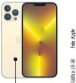
US$1.099 Precio de un iPhone 13 Pro Max de 256GB en Estados Unidos