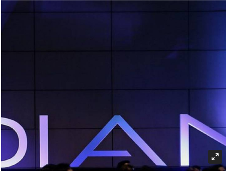
Dian inicia calendario

También alertaron a empresarios de juegos de azar.