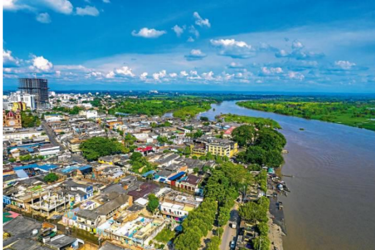
Panorámica del paso del río Magdalena por Barrancabermeja.

Representantes de entidades territoriales, miembros de la bancada parlamentaria y dirigentes de agremiaciones de Santander solicitan al Gobierno nacional la representación de Santander en la Dirección de Cormagdalena y en la junta directiva de Ecopetrol .