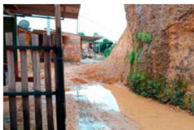
Inicia remoción de talud del 22 de Marzo y Yuma

Los manifestantes dicen estar a la espera de que la empresa cumpla las peticiones de la comunidad, de lo contrario, se mantendrán en cese.