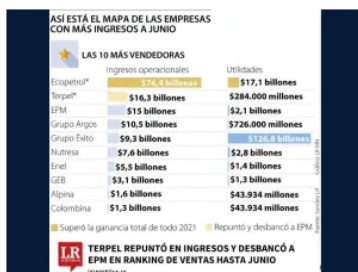
Ranking de las empresas que más vendieron para junio de 2022

Alpina y Colombina se instalan los dos últimos lugares. Ambas marcan las mismas utilidades, 43.934 millones de pesos, sin embargo, la empresa de lácteos tuvo ingresos operacionales de 1.6 billones mientras que Colombina tuvo 1.3 billones de peso en dicho ítem.