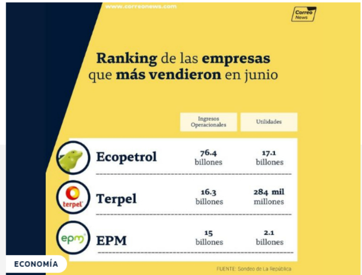
Ranking de las empresas que más vendieron en junio de 2022 en Colombia

CUOTA Facebook Twitter Pinterest WhatsApp