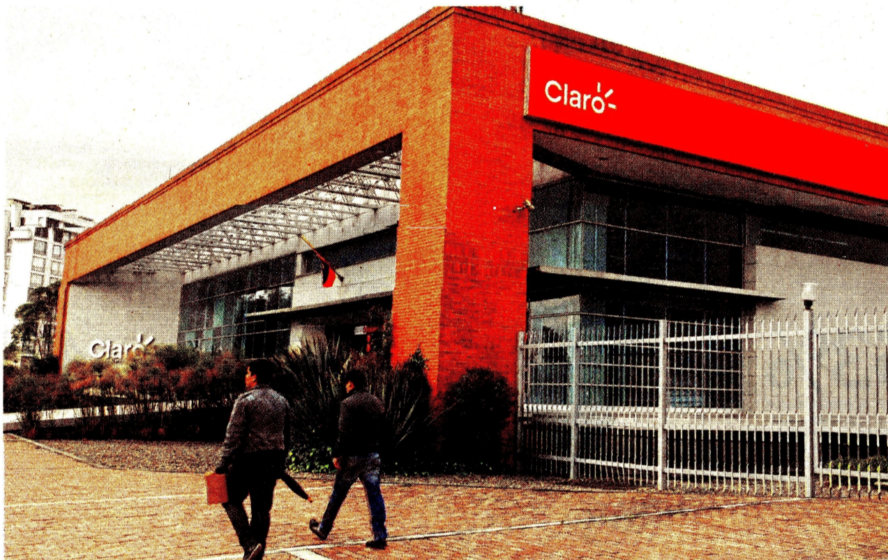
Los ingresos operacionales de Claro Colombia en el segundo trimestre del 2022 sumaron $3,7 billones.

El Grupo Sura, la cuarta corporación del país, reportó unos ingresos operacionales de $14,4 billones a ju-