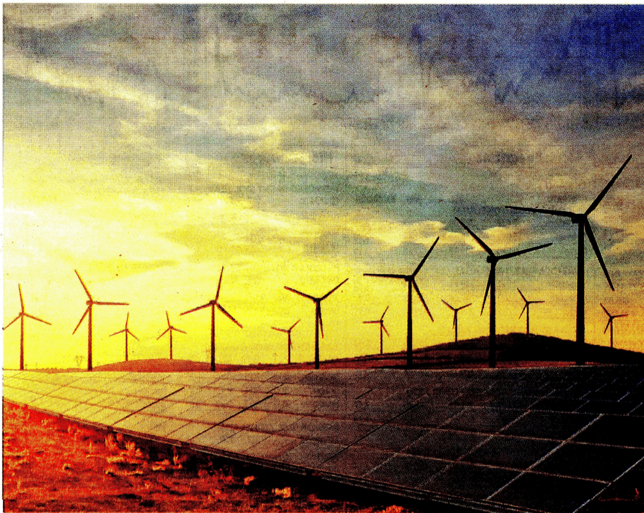
Las principales fuentes son la solar (sol), eólica (viento), hidráulica (agua), geotérmica (tierra), mareomotriz (mar) y la de la biomasa (materia orgánica).