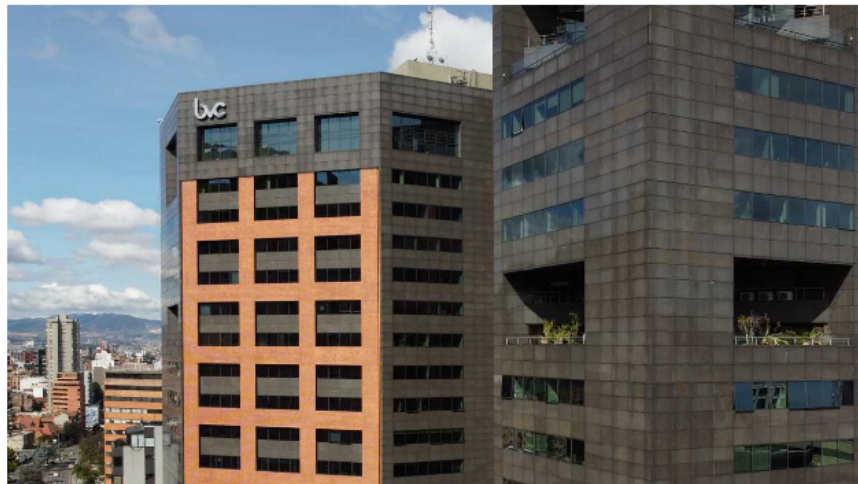
Con este arranque negativo, la BVC rompió la racha de buenos resultados que traía desde el pasado miércoles.

Lastrada por las acciones de empresas del sector de la construcción, la Bolsa de Valores de Colombia comenzó a la baja sus operaciones en la última sesión de la semana, en la que los inversionistas están optando por ser precavidos en tiempos en los que la atención de todos los mercados sigue centrada en la Reserva Federal de los Estados Unidos.