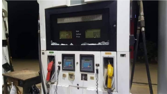
1 Daños en la estación de gasolina del barrio Comodatos de El Bagre

Si hablamos del Ingreso al Producto. Esto será el valor que el Gobierno le paga a los proveedores de petróleo, en este caso hablaríamos puntualmente de Ecopetrol , que en su valor total sería aproximadamente el 50% del precio total.