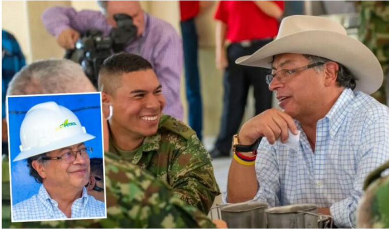
Gustavo Petro visitó a Ecopetrol y a la base militar de Apiay, Meta.