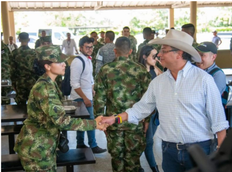
El presidente Gustavo Petro visita base militar en el Meta.

Para almorzar llegó hasta el rancho de tropa del cantón militar de la Cuarta División del Ejército Nacional (Apiay, Meta) y compartió con los soldados y miembros de la fuerza pública.