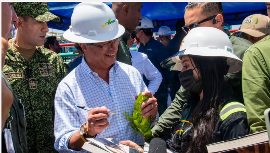
Gustavo Petro firmando libros en el Parque Solar San Fernando.

→ Petro almorzó y conversó con 200 soldados en el Meta