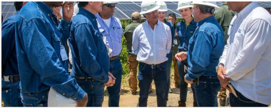
Presidente Petro Dialogando con ingenieros en el Parque Solar San Fernando.