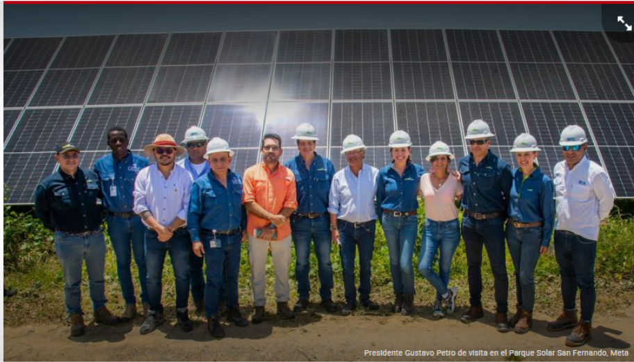
Presidente Gustavo Petro de visita en el Parque Solar San Fernando, Meta

Así lo afirmó el presidente Gustavo Petro a través de las redes de la Presidencia tras visita al proyecto más grande de autogeneración.