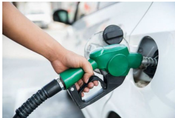
Sin subsidio, el precio del galón de la gasolina podría llegar a los $20.000.