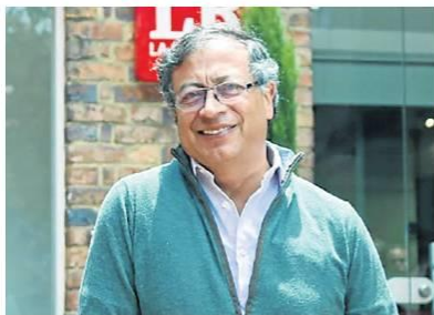
Pierre Ancines / LR

Con la llegada de Petro se siguen sumando los cambios y novedades en la forma que tributarán, no solo los colombianos, sino también quienes están por fuera del país. La consultora PwC indicó que ahora se aplicará una retención de 20% para los no residentes que estará asociada a su presencia económica en Colombia, sujeto a umbral de ingresos, uso de dominios .co o cifra de clientes en el país. (NGG)