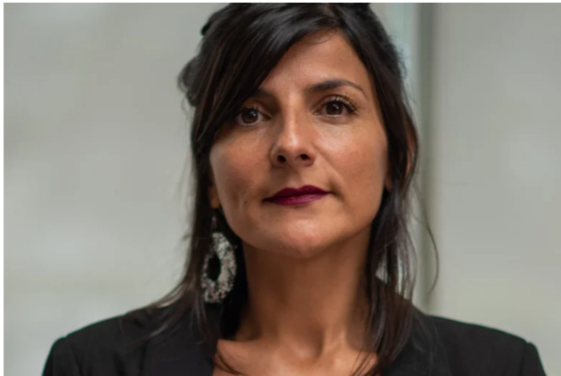
BOGOTÁ 11 de agosto. Ministra de Minas y Energía, Irene Vélez Torres.

Irene Vélez Torres, la nueva ministra de ministra y Energía , dice que uno de los roles principales en este Ministerio es que, junto a otros gremios, haya una transición energética sin traumatismos en entre las empresas, el Gobierno Nacional y el consumidor.