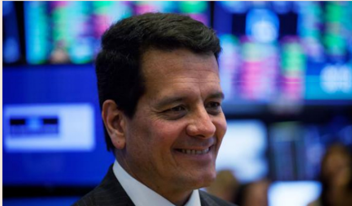
El director ejecutivo de Ecopetrol, Felipe Bayón..

Ecopetrol está solicitando al Gobierno colombiano, su principal accionista, que eleve el precio de referencia para cuando comience a cobrar impuestos a la exportación petrolera.