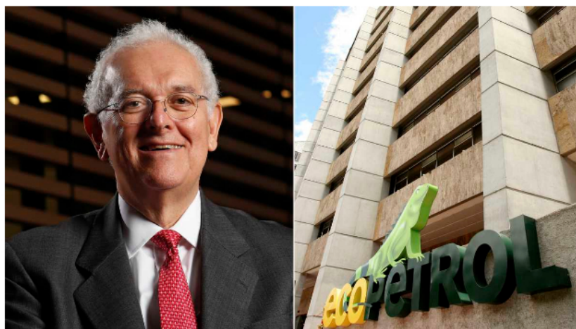
Ocampo y Ecopetrol. Ministro de Hacienda y Crédito Público José Antonio Ocampo. Bogotá agosto 9 de 2022.

El ministro de Hacienda, José Antonio Ocampo, destapó sus cartas y explicó qué busca el nuevo gobierno del presidente Gustavo Petro con la reforma tributaria que fue radicada en el Congreso de la República el pasado 8 de agosto, un día después de la posesión presidencial, así como cuál es la realidad económica y fiscal del país.