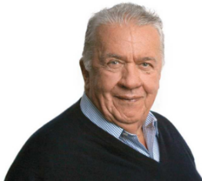
Rudolf Hommes, ex ministro de Hacienda (1990-1994)

Pero aclaró que “toda esta opinadera es con el propósito de que le vaya bien al gobierno y, por esa vía, a Colombia”.