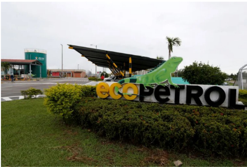
Foto de archivo. La entrada a los campos de producción de Ecopetrol en Castilla La Nueva, en el departamento del Meta, Colombia, 26 de junio, 2018. REUTERS/Luisa González

Así mismo, el ministro reveló que para el Gobierno nacional es sumamente importante garantizar la estabilidad de Ecopetrol .