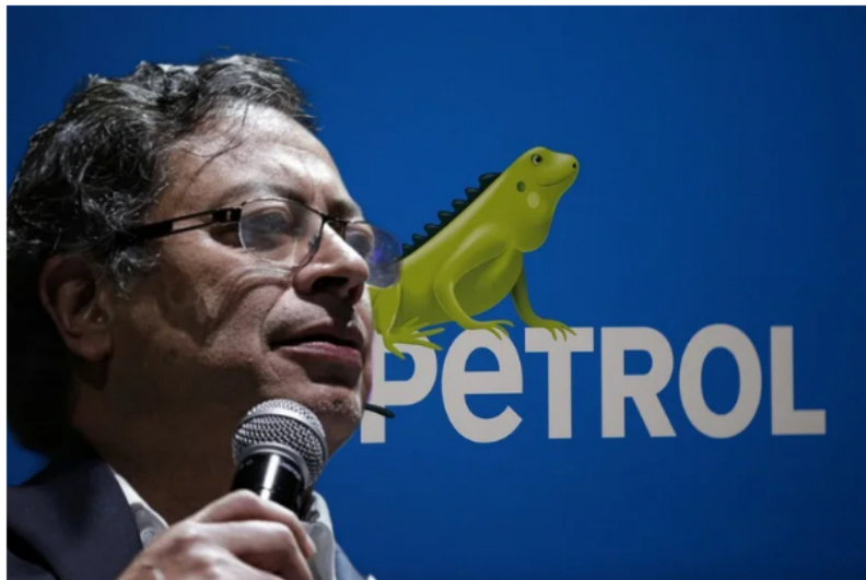
Presidente Petro ya evalúa medidas para garantizar la estabilidad de una de las empresas más funcionales de Colombia: Ecopetrol .

Aunque el tema de la junta directiva de Ecopetrol ha causado múltiples críticas al gobierno de Gustavo Petro , se siguen conociendo los cambios que le harían. El ministro de Hacienda, José Antonio Ocampo , anunció que no cambiarán por completo a los directivos pero sí dio a conocer el número de renuncias que solicitarán.