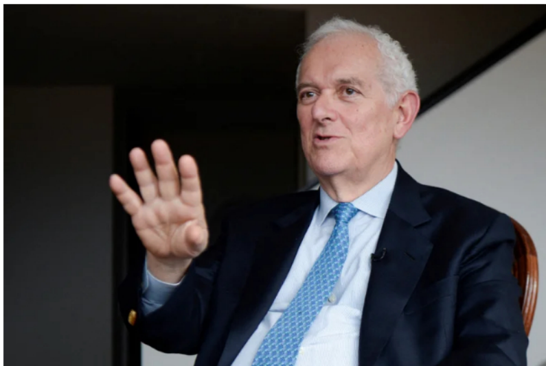
José Antonio Ocampo, ministro de Hacienda.