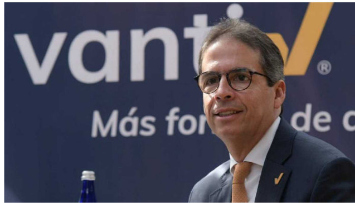
Vanti invertirá $25.000 millones para llevar el servicio de gas natural a nuevas familias.

El presidente Gustavo Petro ha sido claro y reiterativo en asegurar que no permitirá que durante su gobierno se haga fracking en Colombia, a pesar de que existen dos contratos firmados y que el piloto Kalé de Ecopetrol ya cuenta con licencia ambiental desde inicios de 2022.