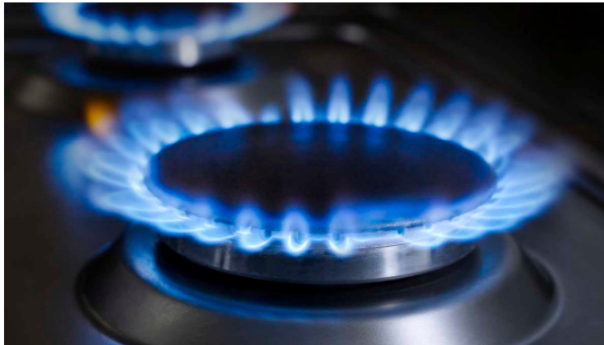
Los hidrocarburos siguen siendo importantes para avanzar en la transición energética.

El presidente de Vanti también anunció que este año se prevén inversiones por 25.000 millones de pesos para extender las redes y llevar el servicio de gas natural a nuevas familias en los 108 municipios de Colombia en los que hace presencia. Cada año la compañía conecta a 100.000 nuevos hogares, que son cerca de 300.000 personas.