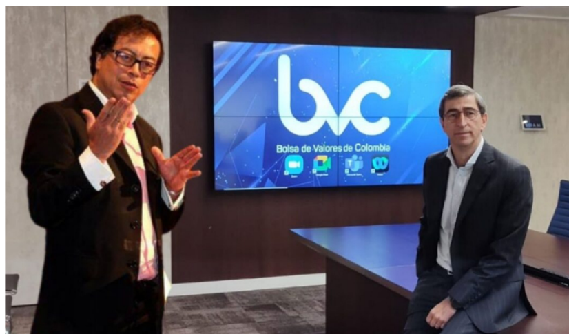
Gustavo Petro podría ser el salvador de la Bolsa de Valores de Colombia.

El índice MSCI Colcap subió 2.5367%, en general el mercado accionario reportó un buen comportamiento que mañana reflejará otro importante resultado ante la presentación de la nueva reforma tributaria.