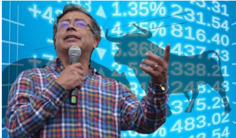
Hasta el momento la Bolsa de Valores de Colombia recibe bien la llegada de Petro a la presidencia.