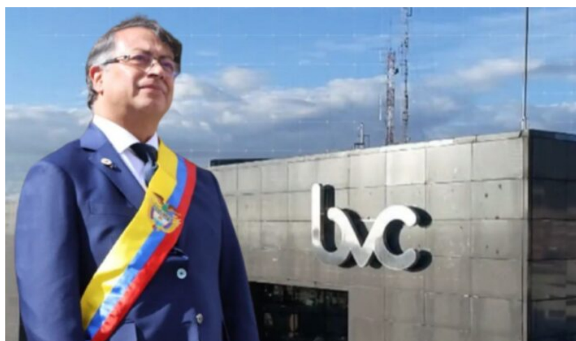
El primer día de Gustavo Petro se reportó en 'verde' en la BVC.

La Bolsa de Valores de Colombia (BVC) reportó un buen comportamiento al alza en la jornada del primer día de Gustavo Petro como presidente de Colombia. Las empresas de BVC entregan sus resultados financieros 2T22.