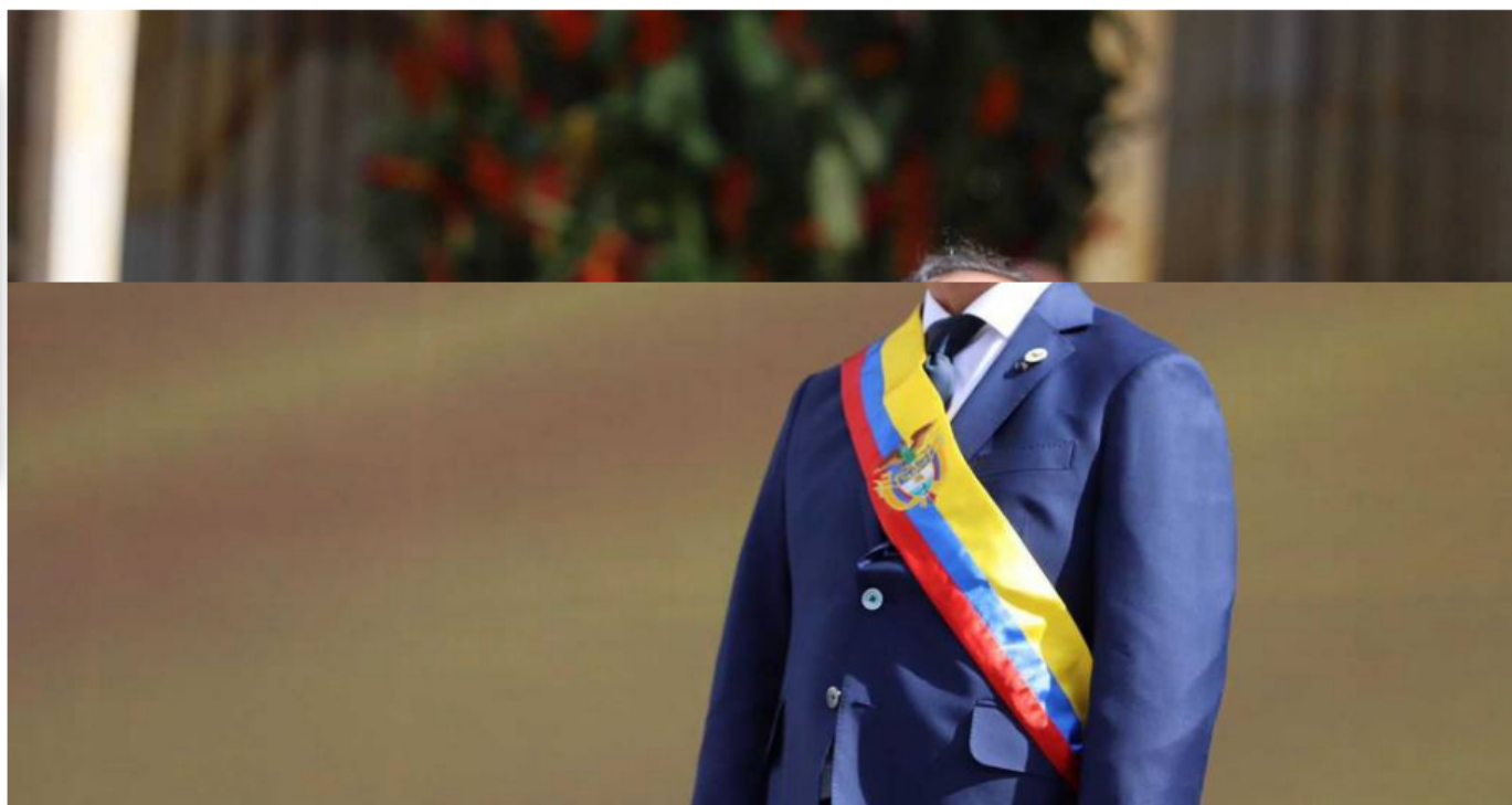
Gustavo Petro, presidente de Colombia. Era Petro inició con dólar a la baja: ¿su discurso tranquilizó los mercados?