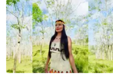
Líder indígena del