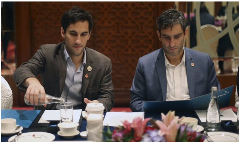
Los hijos de Piñera vendieron su participación en Cemex.

El holding familiar del expresidente de Chile Sebastián Piñera retiró su capital de Colombia a través de la venta de Cemex Latam Latinoamérica (CLH). Ecopetrol cae -4% en BVC a pesar de presentar el mejor resultado financiero.