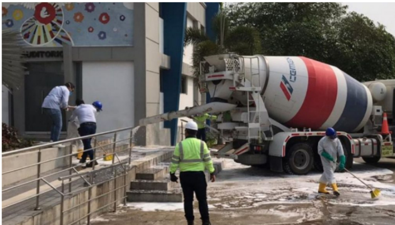
Cemex en Barranquilla en jornada de limpieza que se realizó en el Camino Universitario Distrital Adelita de Char y Hospital Metropolitano Santa María.

La Bolsa de Valores de Colombia (BVC) tuvo una negociación inusual el jueves, la acción CLH subió 16.85% con un volumen de $32 mil millones de pesos.