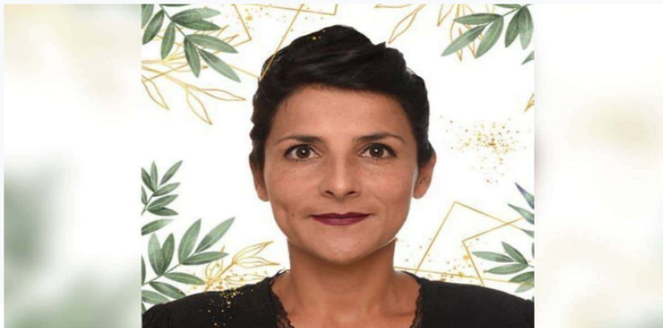
El trino falso que atribuyen a nueva ministra de Minas/Foto: Irene Vélez.

Irene Vélez, filósofa e investigadora, fue nombrada como ministra de Minas y Energía para el Gobierno de Gustavo Petro.