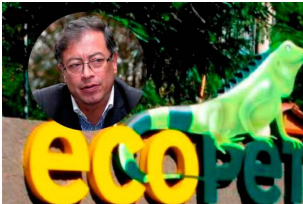
Gustavo Petro tiene una ambiciosa, pero controvertida apuesta de transición energética que implica a Ecopetrol.

Ecopetrol ganó en los primeros seis meses $17,1 billones, fue más del total de 2021.