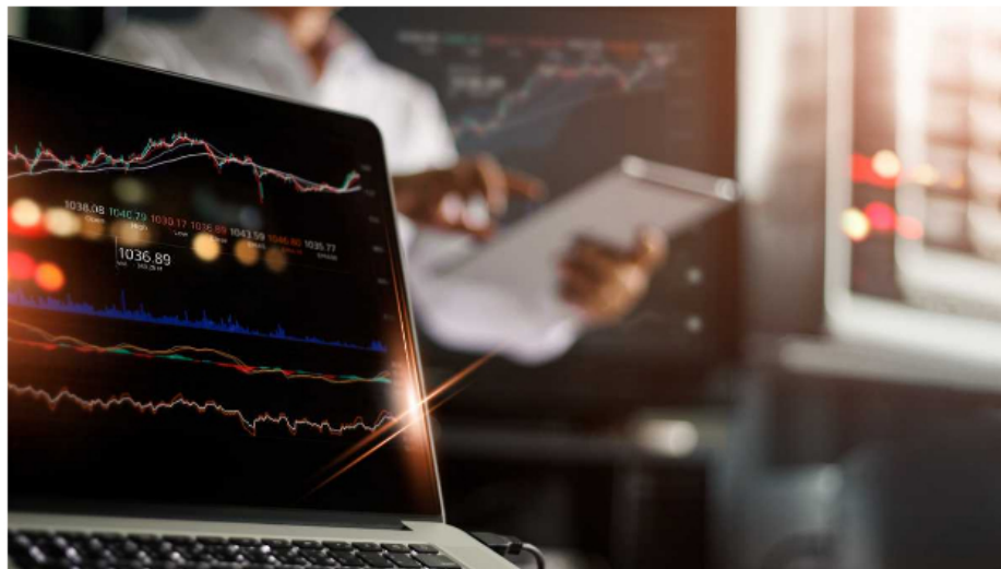
Esta semana ha estado marcada por fuertes altas y bajas para este mercado.

Con una fuerte tendencia a la baja, que incluso golpea a Ecopetrol , comenzó el día para la Bolsa de Valores de Colombia este jueves 4 de agosto en una jornada en la que los inversionistas buscarán recuperar el buen ritmo que traen desde el pasado lunes, pero que se vio interumpido ayer, cuando gran parte de los indicadores terminaron en rojo.