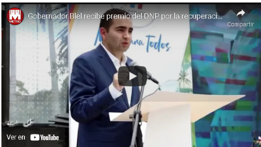
«Un reconocimiento para todos»: Blel

Tras recordar que por su buena gestión en varios campos la Gobernación de Bolívar ha recibido tres reconocimientos : «uno en seguridad , otro por las victimias , por el manejo que le hemos dados a los proyectos en pro de las victimas, y el que hoy me entregan por parte del DNP », el gobernador destacó que «ningún otro reconocimiento es tan significativo como el que hoy recibo», porque, en este caso, se trató de una iniciativa que buscó, y afortunadamente consiguió, « salvar vidas ».