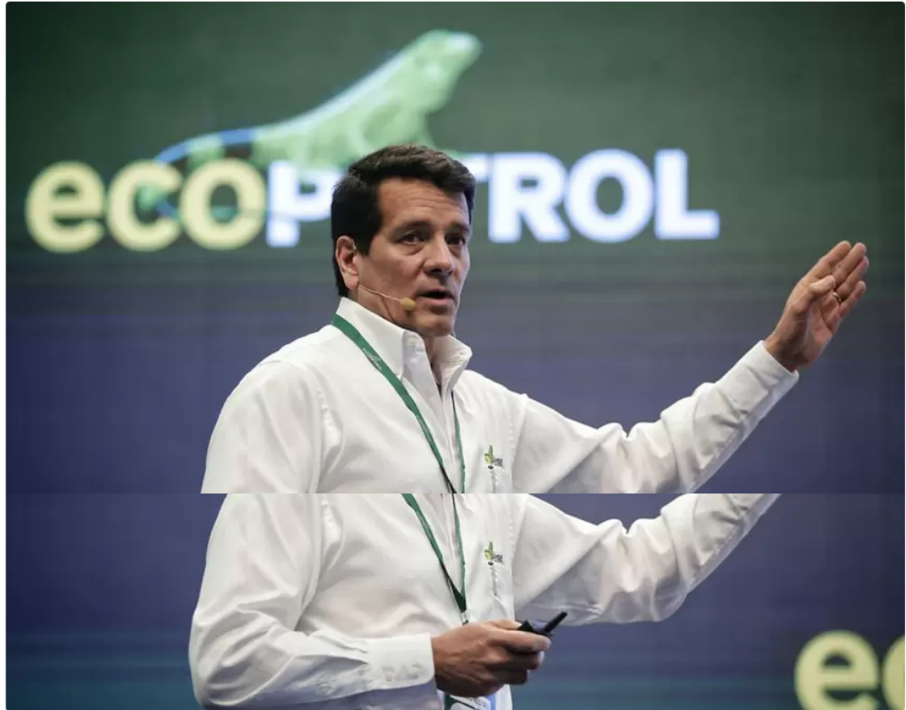
Ecopetrol tiene nuevos bloques en el Golfo de México