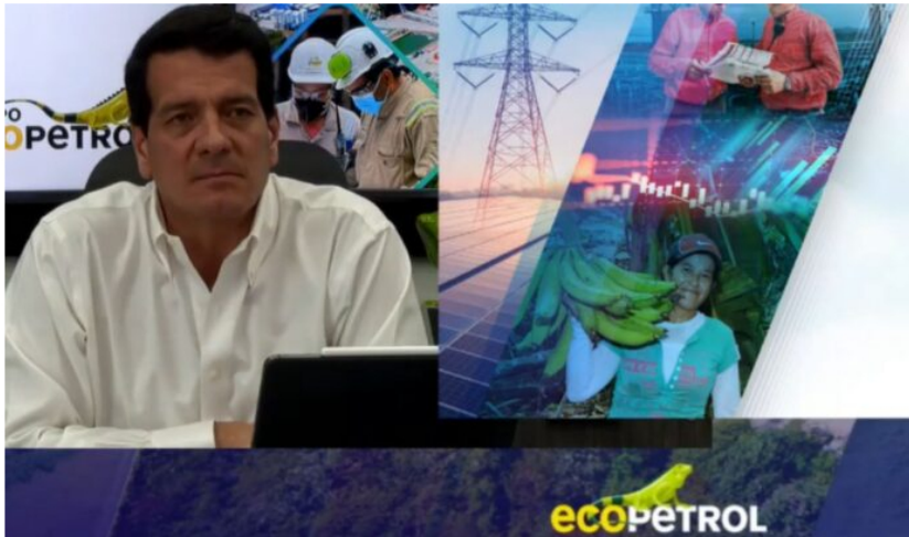
El presidente de Ecopetrol Felipe Bayón presenta los resultados financieros 2T22.

La estatal petrolera Ecopetrol se desplomó -4% ($2.203) en la Bolsa de Valores de Colombia (BVC) a pesar de presentar los resultados financieros más rentables de su historia. Ecopetrol firma acuerdo de movilidad con Toyota para pruebas con hidrógeno verde.