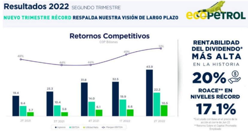
Resultados 2022 segundo trimestre.