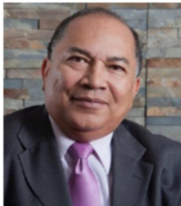
Amylkar Acosta Medina, exministro de Minas.