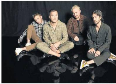
Queen Street Talent

Los banda anunció las fechas de su gira por Latinoamérica, la Mercury World Tour, donde mostrarán su último álbum doble, Mercury — Acts 1 & 2. Imagine Dragons se presentará en Brasil, Argentina y Colombia. En Bogotá se presentarán el 18 de octubre en el Coliseo Live. Las boletas para el público en general estarán disponibles a partir del 10 de agosto y habrá venta desde hoy para el club de fans. (NV)