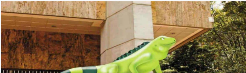
Balance financiero de Ecopetrol del segundo trimestre del año

La petrolera obtuvo una cifra histórica en este semestre de acuerdo con su balance financiero de el segundo trimestre del año.