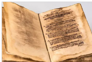
Profecías. Quisieron subastar