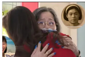
"Siempre pensé en ti". Hija de